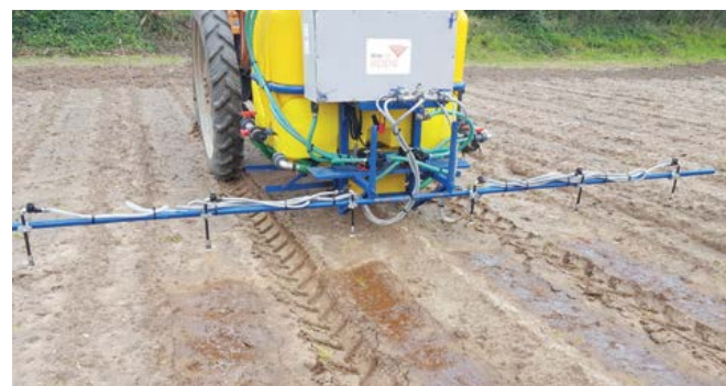
Equipamento de aplicação de fertilizantes líquidos a taxa variável- TECNIFERTI APPS