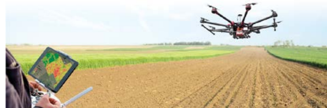
Mapas georreferenciados para identificação de manchas de PH e salinidade, riqueza mineral e retenção de água no solo

A Tecniferti entende que no contexto da AP a fertilização tem de evoluir, tornando-se inteligente, incorporando as tecnologias disponíveis para tratar o igual de forma igual, mas também tratar os solos e áreas com características diferentes de forma distinta, indo ao encontro das suas necessidades específicas, quer quantitativamente, pela variação da quantidade de um produto (HUMIFOSFATO® PlusGel), quer qualitativamente, com a introdução em simultâneo de diferentes produtos (HUMIGEL®).